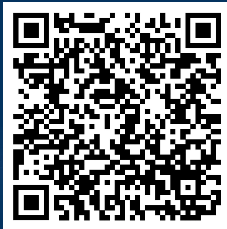
Заявка на участие в Конкурсе